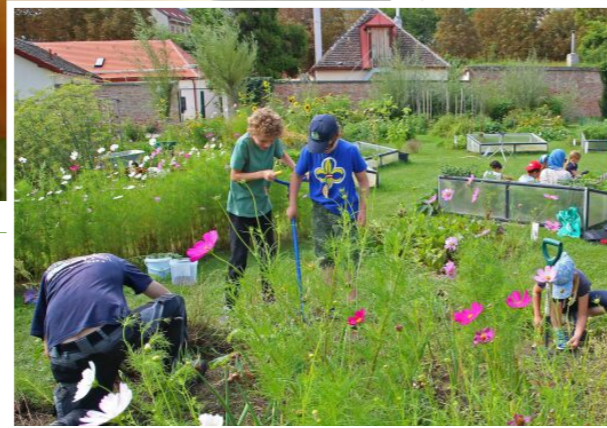
Die City Farm macht auf 2.000 m 2 Freigelände Appetit aufs Gemüsegärtnern. Hier reift eine Paradeiservielfalt, darunter der „Ananasparadeiser“ (Bild oben). Im „Garten der Kinder“ können Junior-Cityfarmer Erlebnisferien verbringen (Bild rechts)